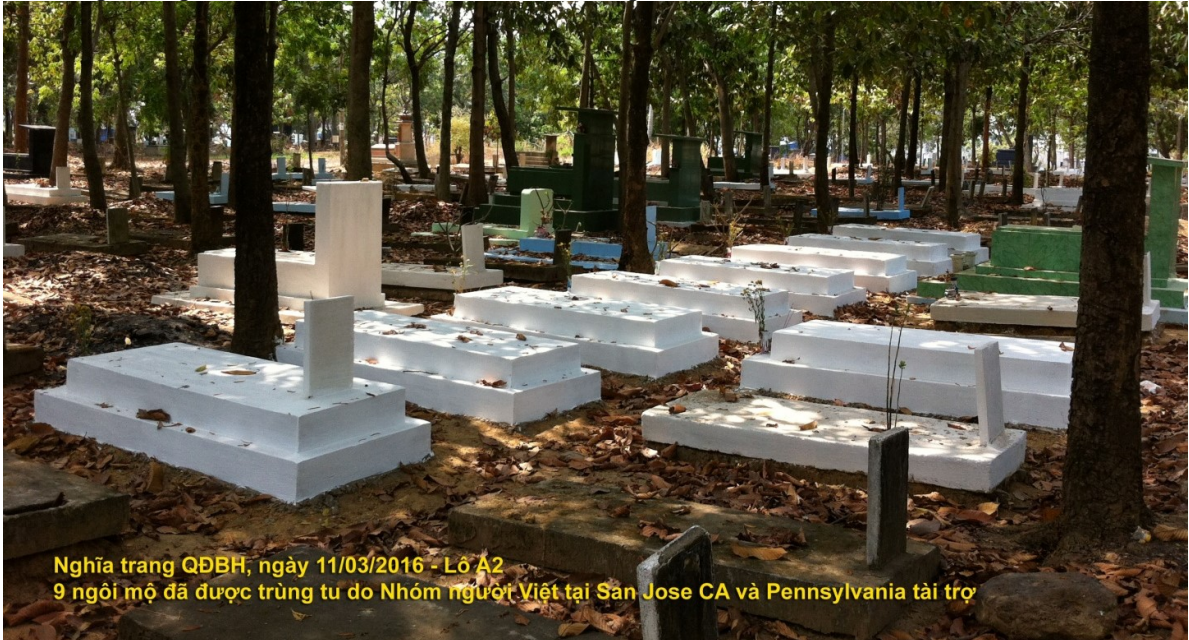
Nghĩa trang QĐBH, ngày 11/03/2016 - Lô A2 9 ngôi mộ đã được trùng tu do Nhóm người Việt tại San Jose CA và Pennsylvania tài trợ

29/ Nhóm Việt kiều tại San Jose CA và Pennsylvania (nhóm đã làm hợp đồng số 6, tài trợ 10 ngôi tại Lô I1) đã làm 20 ngôi vào giữa tháng 2/2016 (9 ngôi ở Lô A2 và 11 ngôi ở Lô A1)