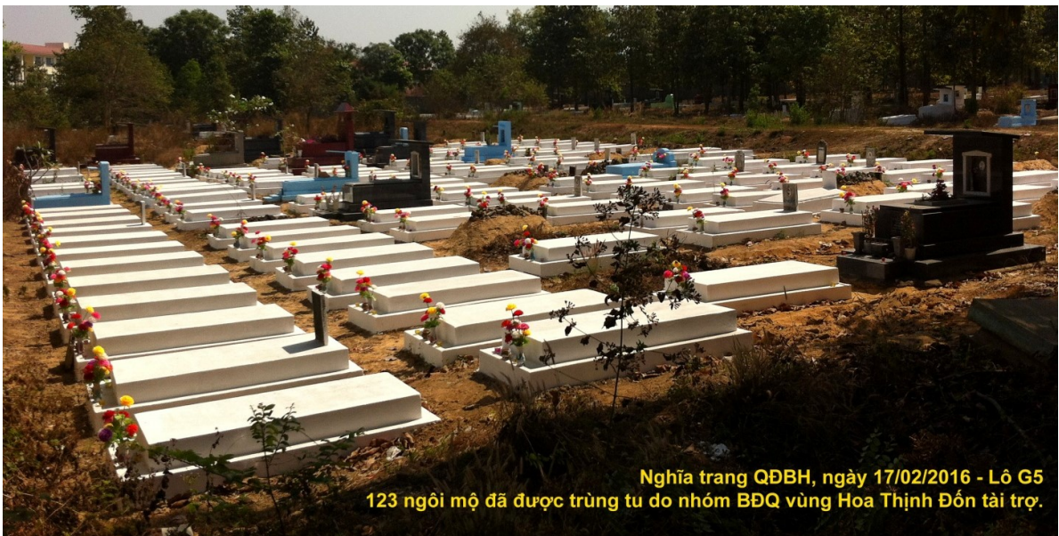
Nghĩa trang QĐBH, ngày 17/02/2016 - Lô G5 123 ngôi mộ đã được trùng tu do nhóm BÐQ vùng Hoa Thịnh Đồn tài trợ.