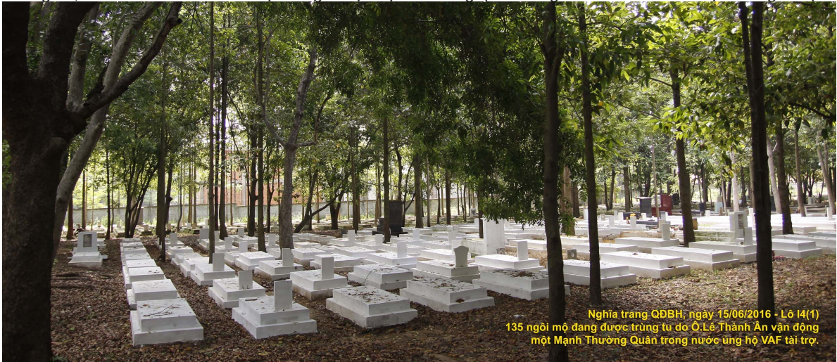
Nghĩa trang QĐBH, ngày 15/06/2016 - Lô I4(1) 135 ngôi mộ đang được trùng tu do Ô.Lê Thành Ân vận động một Mạnh Thường Quân trong nước ủng hộ VAF tài trợ.

30/ HĐ 135 ngôi mộ ở Lô I4 (1) do một Thân Hữu của VAF vận động và tài trợ. Hợp đồng ký ngày 09/03/2016. Trong đó, Thân Hữu của VAF tài trợ 32 ngôi mộ. Mạnh thường quân trong nước của VAF tài trợ 103 ngôi mộ.