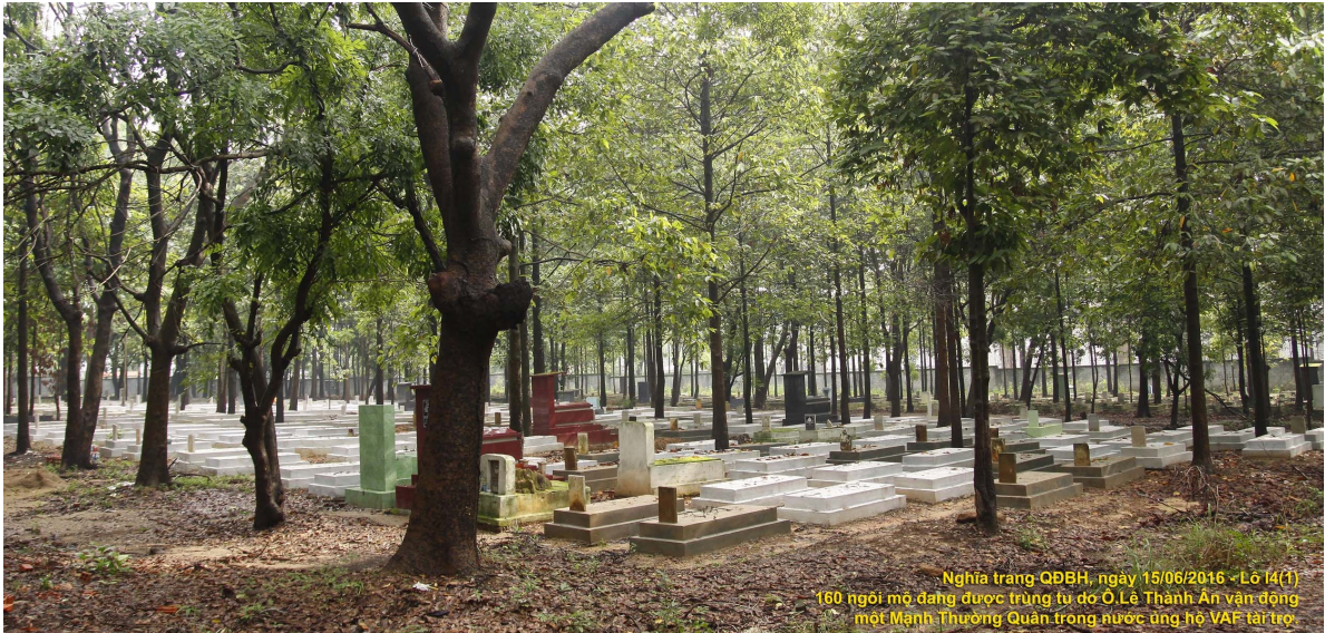
Nghĩa trang QĐBH, ngày 15/06/2016 - Lô I4(1) 160 ngôi mộ đang được trùng tu do Ô.Lê Thành Ân vận động một Mạnh Thường Quân trong nước ủng hộ VAF tài trợ.

BQT làm dư 3 ngôi thành 163 ngôi - 155 ngôi ở Lô I4(1) và 8 ngôi ở Lô I4(2)