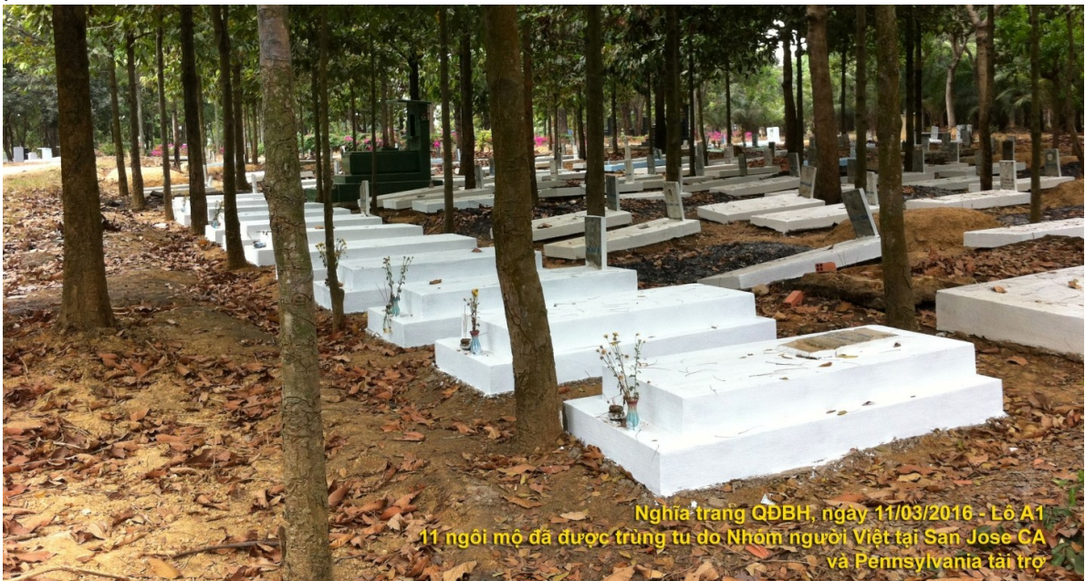
Nghĩa trang QĐBH, ngày 11/03/2016 - Lô A1 11 ngôi mộ đã được trùng tu do Nhóm người Việt tại San Jose CA và Pennsylvania tài trợ